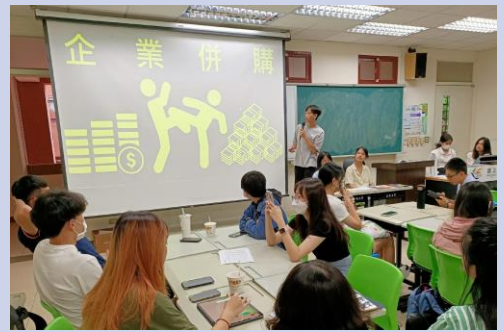
小組製作產業研究報告